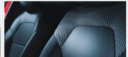
INFORM Stoffsitze schwarz