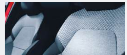
INVITE Stoffsitze grau/schwarz