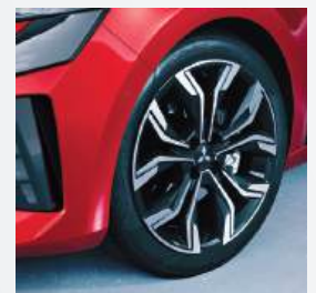
17" Leichtmetallfelgen ▲ Intense, Diamond