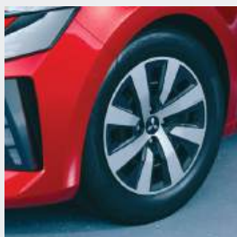
15" Stahlfelgen ▲ mit Radzierkappen Inform, Invite