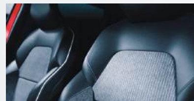
DIAMOND Sitze aus Stoff und hochwertiger Ledernachbildung in Schwarz