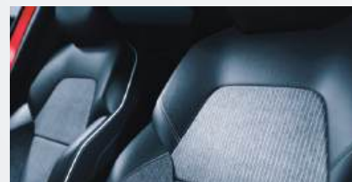
INTENSE Sitze aus Stoff und hochwertiger Ledernachbildung in Schwarz